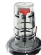
新品のタンクゲージ